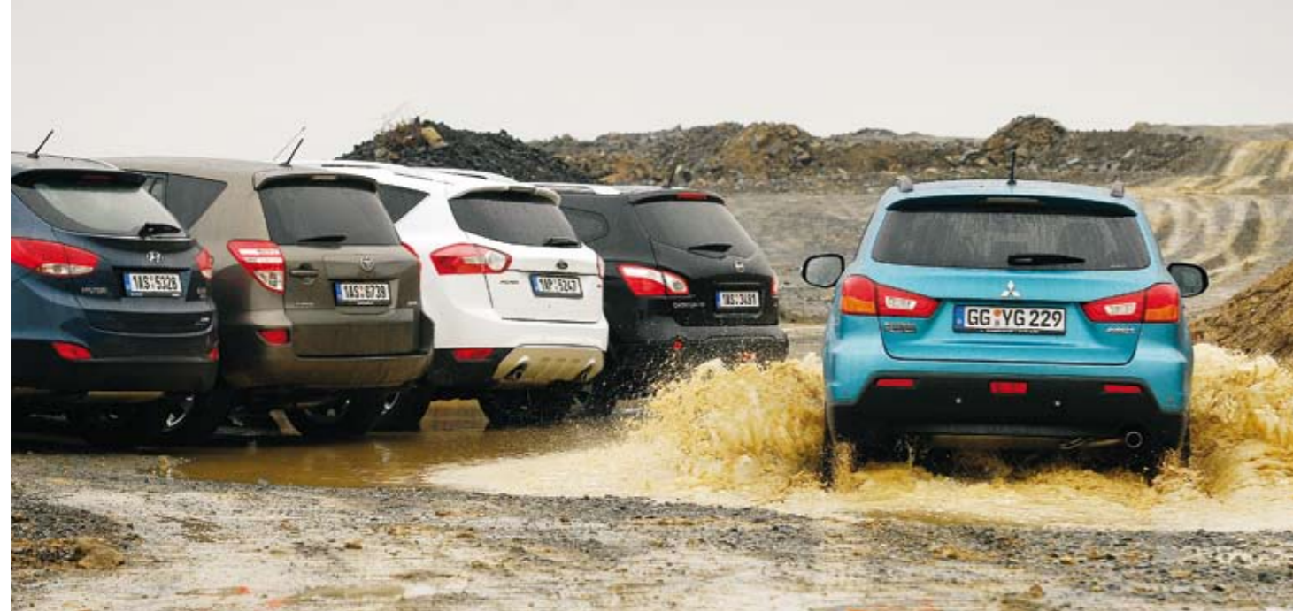
ASX SEŽENETE NEJLEVNĚJI a jeho standardní výbava není vůbec špatná. Vyjma testované verze bude brzy k dispozici ještě provedení 1.8 DiD/116 koní a na příznivce benzinových motorů čeká šestnáctistovka s výkonem 117 koní.